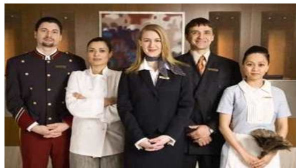
< PA >