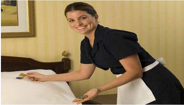
< Room Attendant >