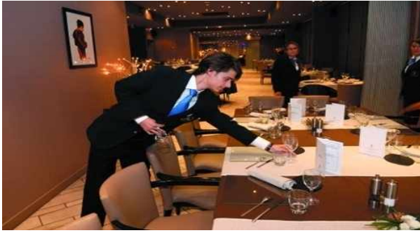
< F&B >