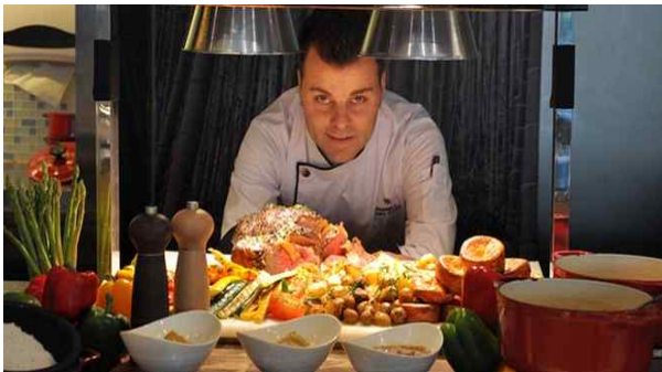
< Kitchen Steward >