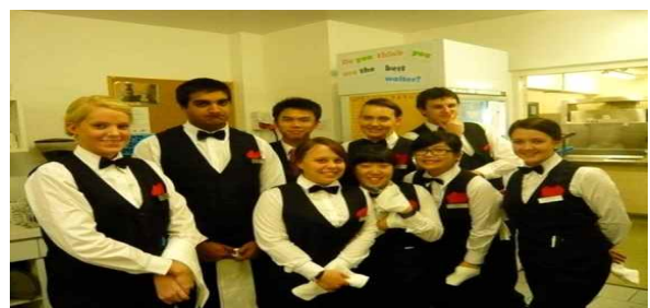
< F&B Crews >