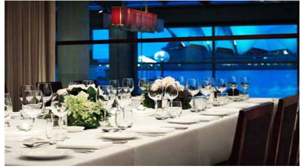
< F&B >