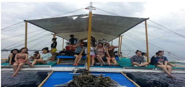
< Activity Tour Guide >