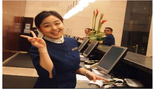
< Front Desk >