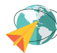
○ 글로벌 스터디 Global Study

As one of the highest regarded education programs in Korea, Asan Frontier Youth aims to cultivate and empower the next generation of Korean leaders in the nonprofit sector. The program includes rigorous training in intellectual understanding and real-world experiences.