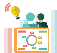
○ NGO 인턴십 NGO Internship

아산 프론티어 유스(Asan Frontier Youth) 는 기업이 정신을 갖춘 비영리(Nonprofit) 분야 차세대 인재를 양성하기 위한 교육 프로그램입니다. NGO 인턴십, 임팩트 교육, 글로벌 스터디 과정으로 이루어져 있으며, 참가자들은 현장과 이론을 함께 학습하며 비영리 분야에 전반에 대한 관점을 확립해 나갑니다. 또한 다양한 사회 문제를 고민하고 해결 방안을 탐구하며 문제해결능력을 향상할 수 있습니다. 국내외 다양한 비영리 분야 전문가와의 교류를 통해 인적 네트워크를 형성하고 진로를 구체적으로 설계하는 기회도 만나게 됩니다. 대한민국 최고 수준의 대학생 대상 비영리 교육 과정으로서 더 나은 세상을 만들고자 하는 젊은이라면 누구나 참가할 수 있습니다.