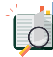
○ 임팩트 교육 Impact Education